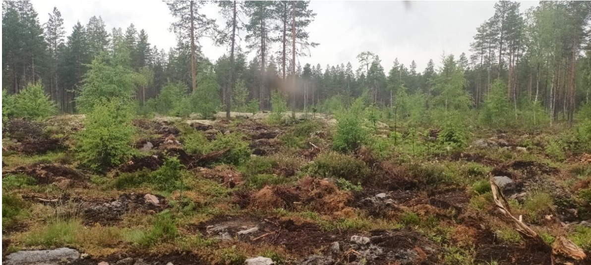
Kuva 4-4. Sähköasemavaihtoehdon S2 alue on hakkuuaukeaa.

Eteläisen sähköasemavaihtoehdon S2 alue on hakkuuaukeaa (Kuva 4-4). Alue on todennäköisesti kuivahkoa kangasta (EVT). Pensaskerroksessa kasvaa kuusen, männyn ja hieskoivun taimia. Varhaiselle sukkessiovaiheelle tyypillisesti kenttäkerroksessa kasvaa saroja ja muita heiniä sekä maitohorsmaa. Muita runsaita lajeja ovat kanerva, suopursu, puolukka ja metsätähti. Pohjakerroksessa kasvaa metsäkerros-, kangaskarhun- ja seinäsammalta. Pohjakerros on paikoin paljas maanmuokkauksen vuoksi. Kalliopaljastumia peittävät valko- ja harmaaporonjäkälät.