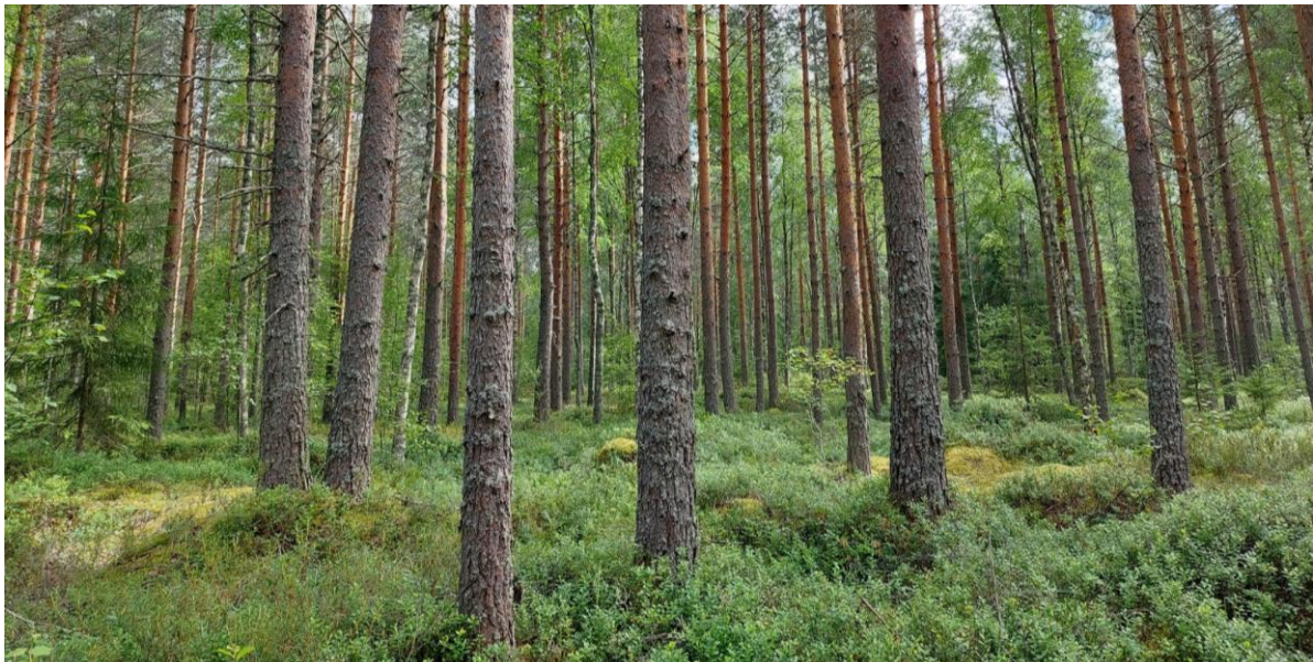
Kuva 4-2. Sähköaseman W2 alue on puolukaturvekangasta.

Läntinen sähköasema W2 sijaitsee puolukaturvekankaalla (Ptkg I) (Kuva 4-2). Puuston valtapuu-laji mänty on yli 60-vuotiasta. Sekapuuna kasvaa satunnaisia kuusia ja hieskoivuja. Kenttäkerroksessa metsä- ja suovarvut ovat yhtä runsaita. Runsaimpia ovat suopursu, juolukka, puolukka ja mustikka. Pohjakerroksessa on runsaasti seinä- ja metsäkerrossammalta, mutta kosteissa painanteissa esiintyy rämerahkasammalta.