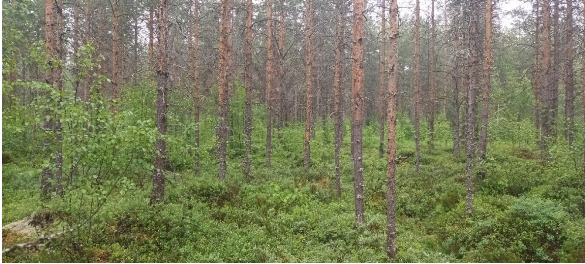
Kuva 4-3. Sähköaseman S1 alue on puolukkaturvekangasta.

kanerva, variksenmarja, metsäkastikka ja maariankämmekkä. Pohjakerroksessa kasvaa seinä-, kangasrauhka- ja kangaskarhunsammal.