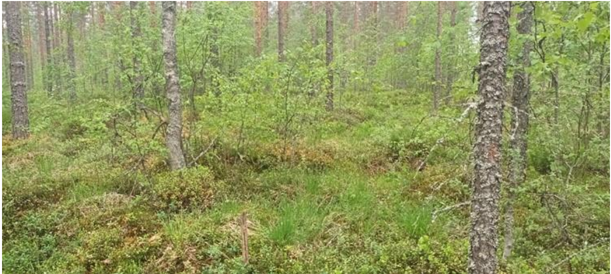
Kuva 4-1. Sähköaseman W1 alue on puolukaturvekangasta.

kevätipiippo, maitohorsma, kurjenjalka, metsätähti, metsäalvejuuri ja pullosara. Pohjakerroksessa kasvaa kangaskarhun-, seinä- ja metsäkerrossammalta. Rämeisyyttä ilmentävät pohjakerroksen rahkasammalet.