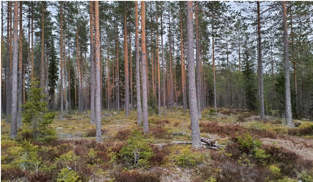
Kuva 3-1. Metson soidinympäristöä Virtojen puolella.