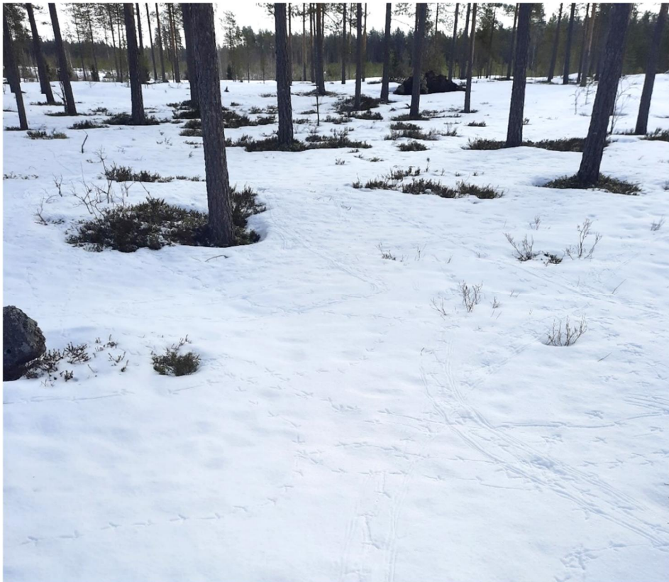
Kuva 4-2. Teerien soidinjälkiä havaittiin epätyypillisesti hyvinkin puustoisilta paikoilta.