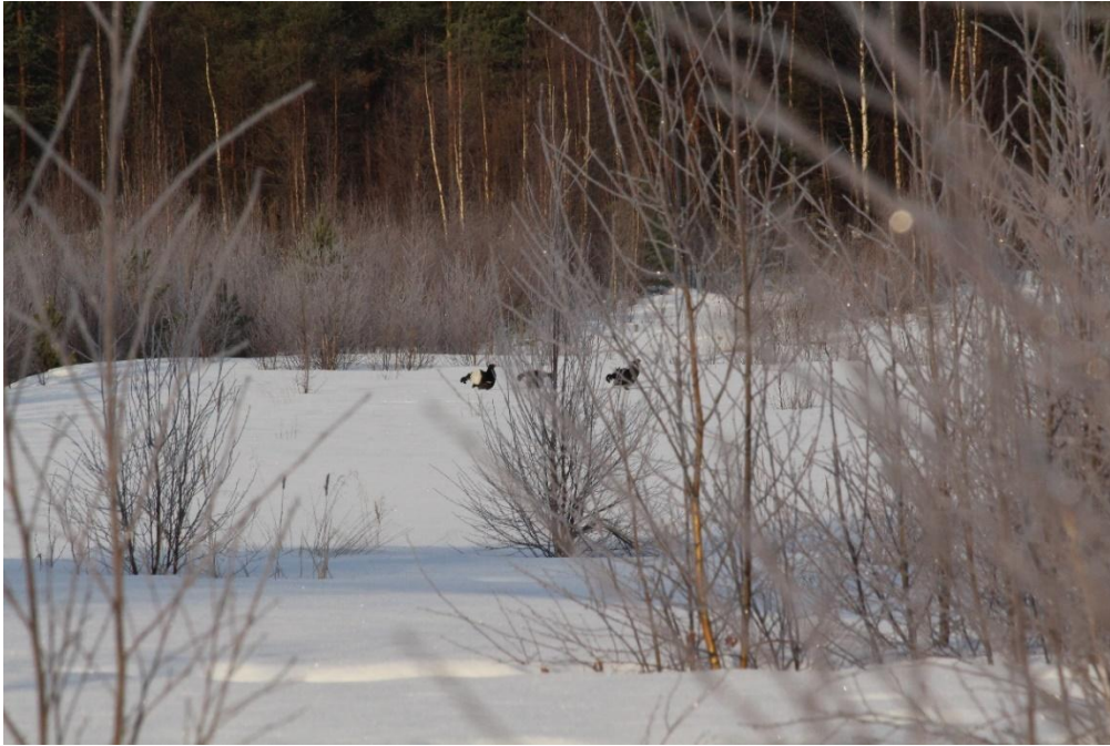
Kuva 4-1. Teeriä soittimella entisellä turveaumalla.