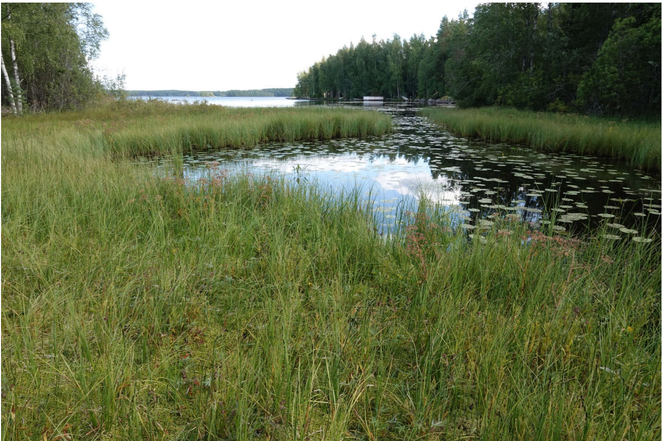
Kuva 7. Pieni nevarantainen poukama selvitysalueen länsipuolella.

Suomen Lajitietokeskuksen aineistoihin (Suomen Lajitietokeskus 2025) ei ole selvitysalueelta tai sen lähiympäristöstä tallennettu havaintoja uhanalaisista tai silmälläpidettävistä lajeista, EU:n lintudirektiivin I-liitteen lajeista tai EU:n luontodirektiivin II- ja IV-liitteiden lajeista.