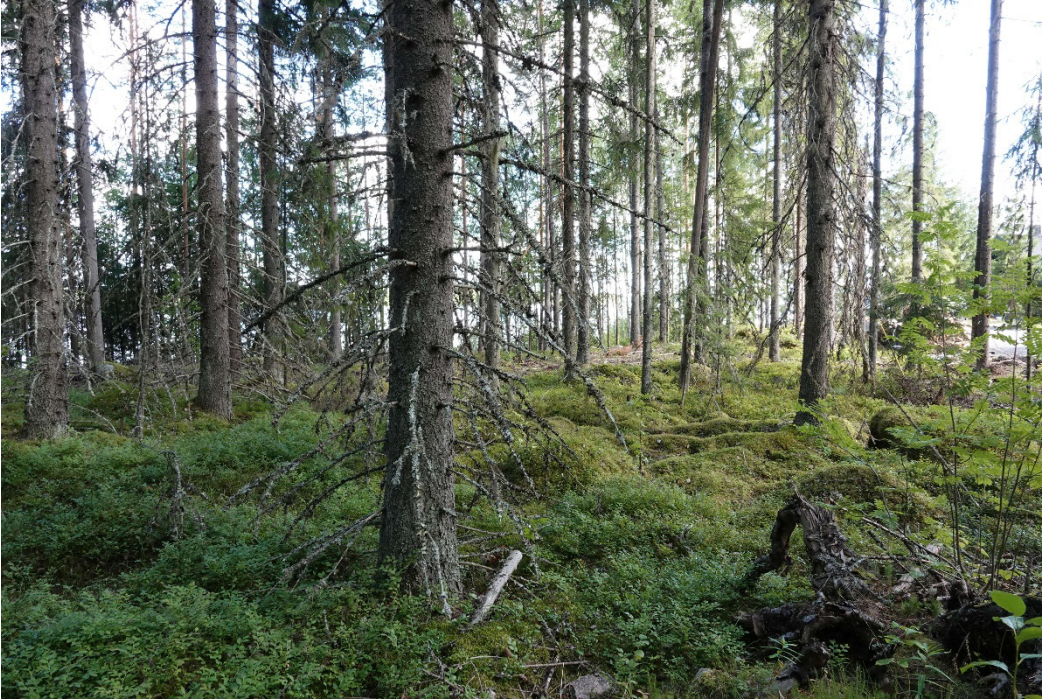
Kuva 2. Kuusimetsää luontotyyppikuviolla 1.