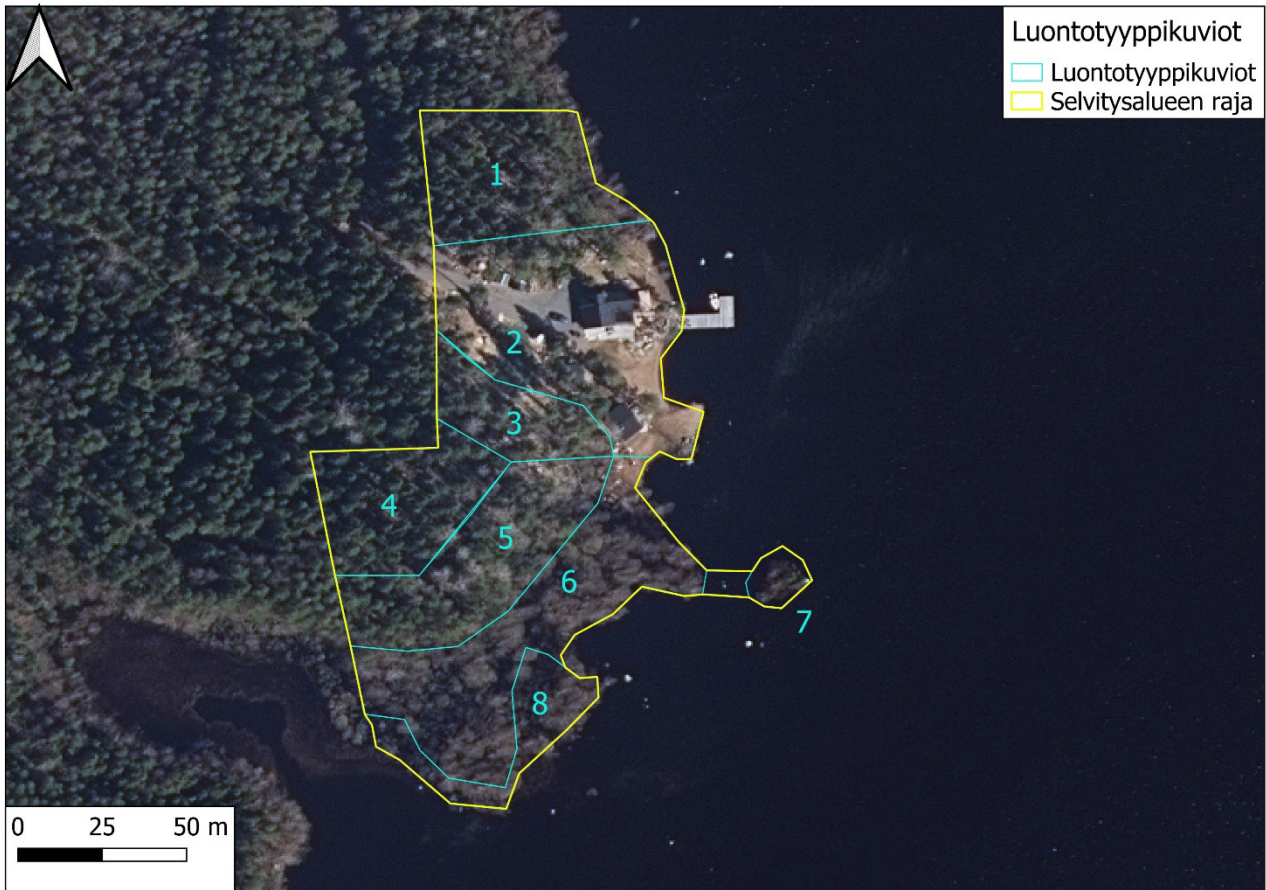
Kartta 3. Luontotyyppikuviot ilmakuvalla.