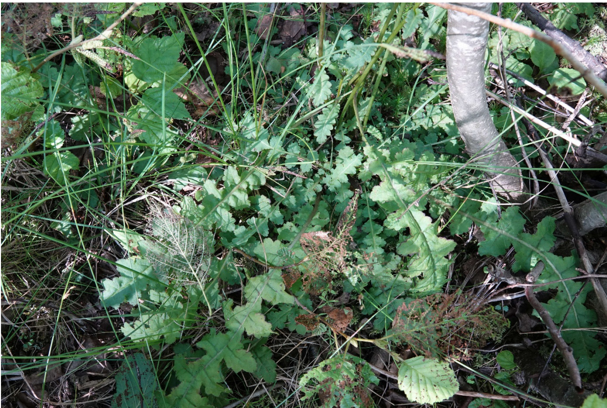
Kuva 5. Kaarlenvaltikan lehtiruusuke.