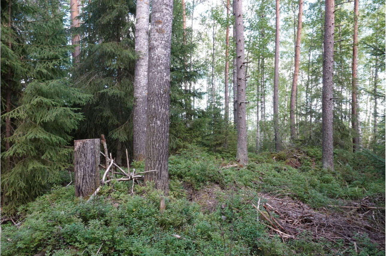
Kuva 3. Puustoa luontotyyppikuviolla 5.

vaarantunut luontotyyppi. Kuvio on tavanomaista talousmetsää ja ekologiselta laadultaan heikko.