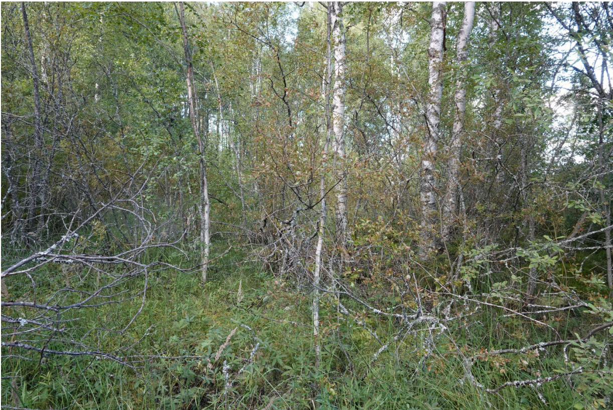
Kuva 1. Kivilahden rantaluhtaa.

uhanalaisuusluokan lisäksi luontotyyppin ekologinen laatu. Esimerkiksi tavanomaisena talousmetsänä käsitelty voimakkaasti harvennushakattu, lahoppuustoltaan niukka, varttunut kuiva kangasmetsä kuuluu uhanalaisluokkaan vaarantunut (uhanalainen), mutta on ekologiselta laadultaan heikko, sillä luontotyyppin tila on voimakkaasti heikentynyt, kun ihmistoiminta on perin pohjin muuttanut metsän luontaisia ominaispiirteitä. Sen sijaan ekologiselta laadultaan erinomaiset ja hyvät kohteet ovat jo tällä hetkellä luontoarvoiltaan merkittäviä. Laadultaan kohtalaiset ja heikot kohteetkin kehittyvät toki aikaa myöten paremmiksi, jos ne jätetään luonnontilaan (tai perinnebiotooppien kohdalla aloitetaan asianmukainen hoito). Luontaisesti harvinaisten luontotyyppien (kuten lähteiden ja kalkkikallioiden) ja perinnebiotooppien kohdalla asian merkitys korostuu, ja ne voivat olla luontoarvoiltaan merkittäviä laadultaan heikkoinakin.