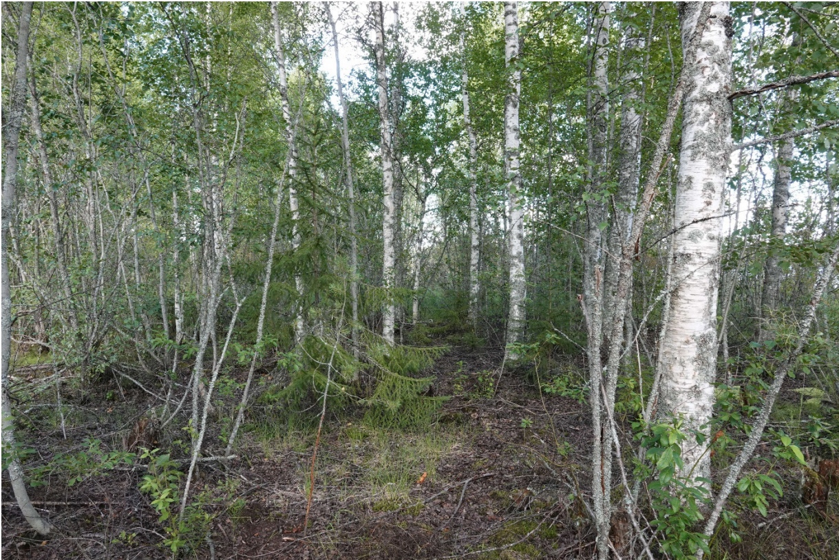
Kuva 4. Kostea rantakoivikkoa.